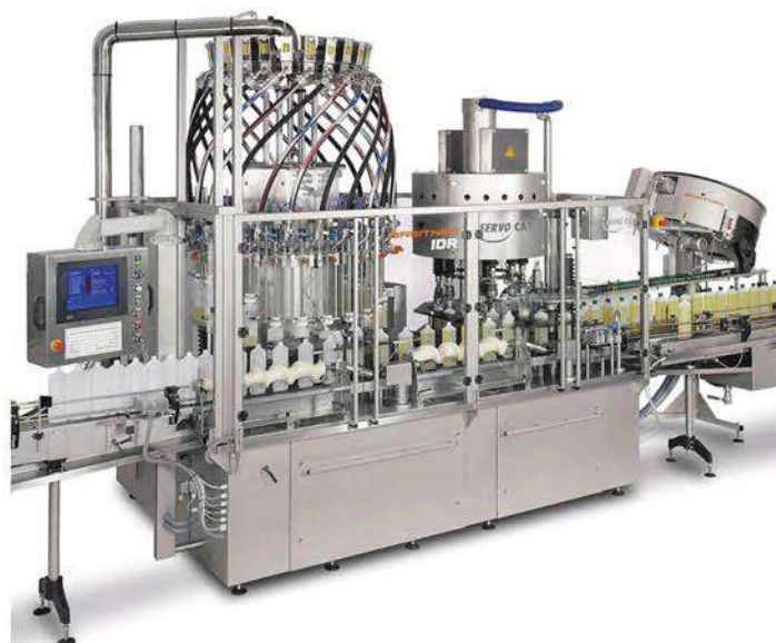
Roterend vul- en sluitsysteem

Tevens uw specialist voor het verpakken van ijzerwaren, poeders en tabletten