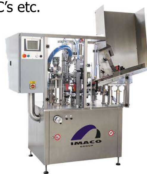
Afvulmachine voor tubes