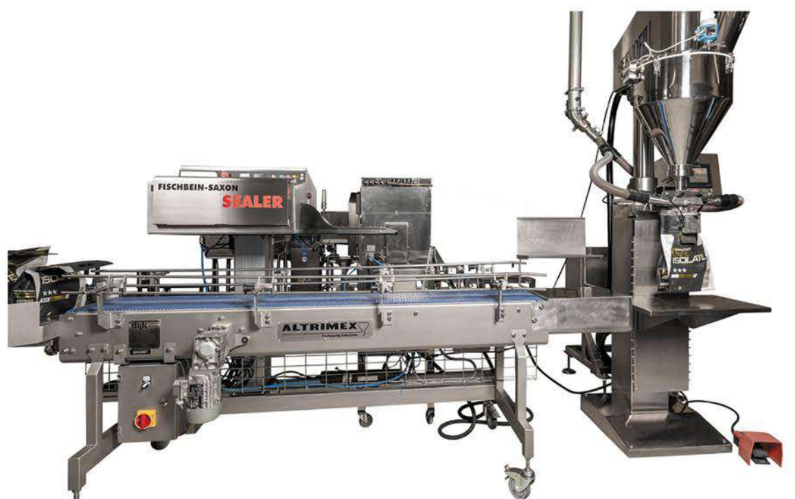
flexible Füll- und Verschleißlinie für Beutel und Doypacks

auch Ihr Spezialist für Eisenwaren, Flüssigkeiten und Tabletten