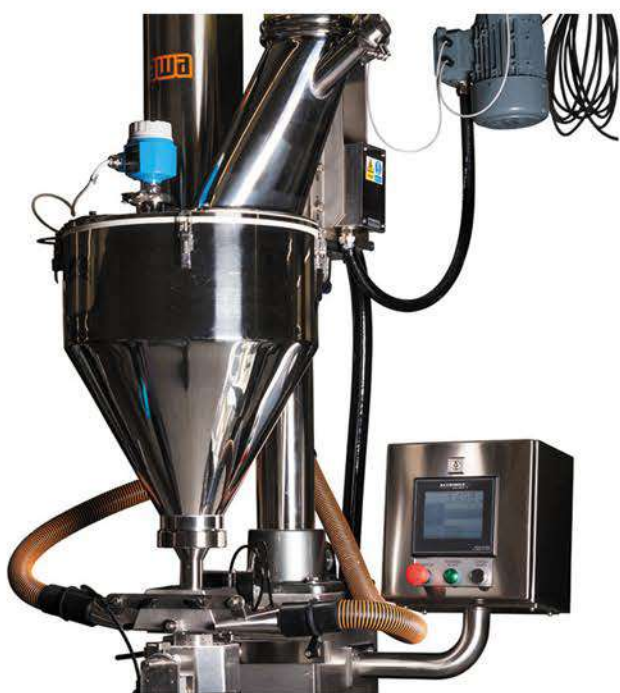
Schneckendosierer mit Wiegesystem