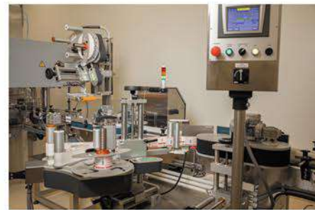
Etikettieren / Kodierung